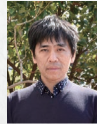
にしざわ りゅうえ 西沢 立衛