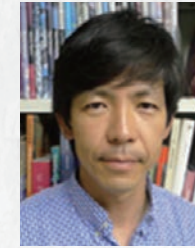
つかもと よしはる 塚本 由晴

経歴 1966年 東京都生まれ 1990年 鎌倉市建築設計事務所入所 1992年 鎌倉市建築設計事務所代表 1995年 鎌倉市世帯共済 SANA 設立 1997年 西沢立衛建築設計事務所設立 主な受賞 日本建築学会賞、都市文化財助成金、文化庁新鋭奨励賞、藤田正武賞、ペルリン賞、ブリツラー賞など 主な作品 金沢 21世紀美術館、十和田市現代美術館、ROLEX ラーニングセンター、豊島美術館、軽井沢千住博美術館、ルーフ・ランス、津市市美術館、ホッコーニクスキャンパス、ラ・サマリテラスなど。 (*は SANA として鎌倉市との共同設計及び受賞)