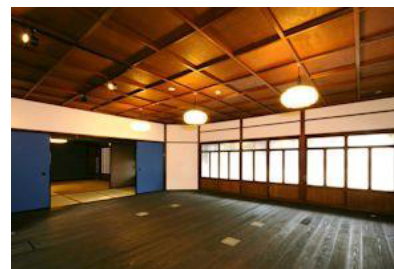
学生のいえ(2次審査会場)